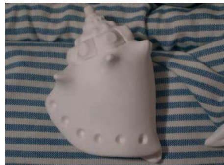
LAME DE FOND